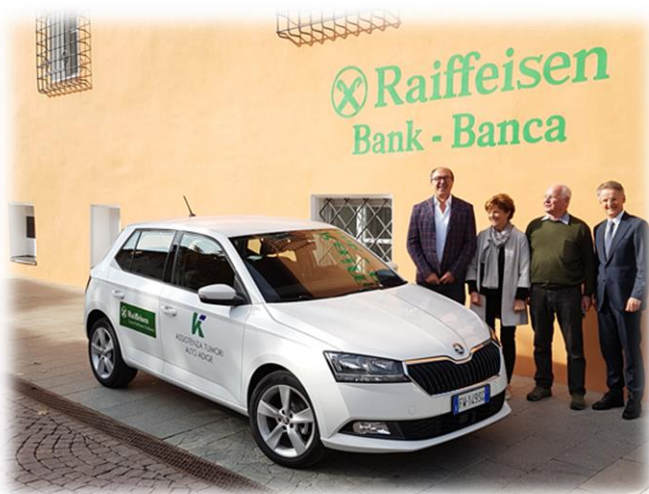
Übergabe des Betriebsautos an die Krebshilfe Hochpustertal, welches von der Raiffeisenkasse Toblach angekauft worden ist.