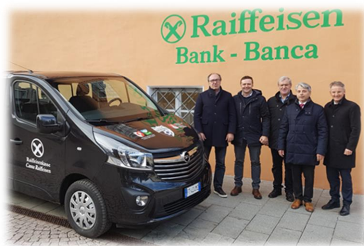
Übergabe des neuen Sportbus an den AFC Hochpustertal; die Raiffeisenkasse Toblach hat den Ankauf des Busses gemeinsam mit der Raiffeisenkasse Hochpustertal unterstützt.