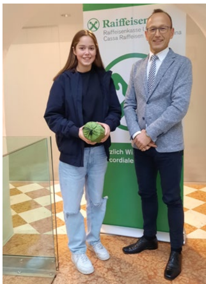
Greta Nössing Filiale Branzoll