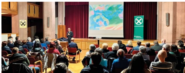
Gesundheitstag im Kulturhaus Branzoll