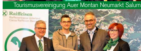
Verein der Vereine Auer