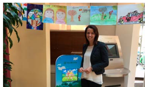
Die Malarbeiten in Leifers