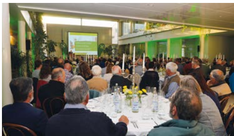
Festliches Ambiente im Sitz der Gruber Logistics in Auer