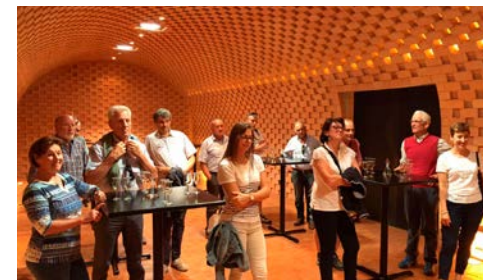
Besichtigung der Puni Whisky Destillerie in Glurns