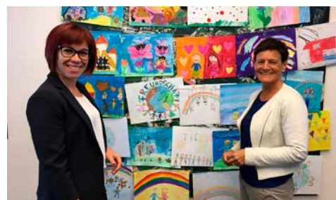
Die Bilderwand in der Geschäftsstelle Auer