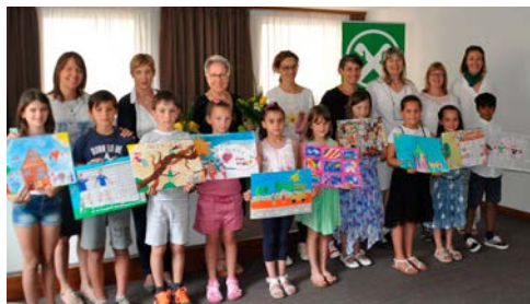
Die Gewinnerinnen und Gewinner aus dem Unterland