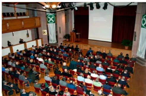
Über 200 Mitglieder fanden sich im Kulturhaus Branzoll ein.

Sie haben Fragen oder möchten einen Beratungstermin vereinbaren? Ihr Berater ist jederzeit für Sie da!