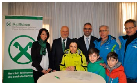
Sci Club Laives