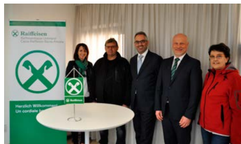
Pol. Libertas Raiffeisen

Mit der finanziellen Unterstützung der Vereine und Organisationen will die Raiffeisenkasse gemäß ihrem Leitbild „einen Beitrag für die soziale Entwicklung im Südtiroler Unterland leisten“ und ihren Dank und ihre Wertschätzung für die vielen ehrenamtlich tätigen Bürgerinnen und Bürger zum Ausdruck bringen.