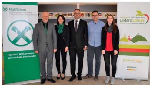
Tourismusverein Leifers Branzoll Pfatten