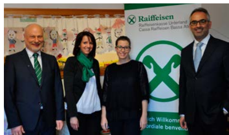
Gen. Deutscher Kindergarten und Kulturheim Leifers