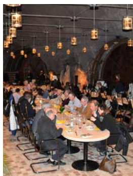
Weinverkostung im Felsenkeller