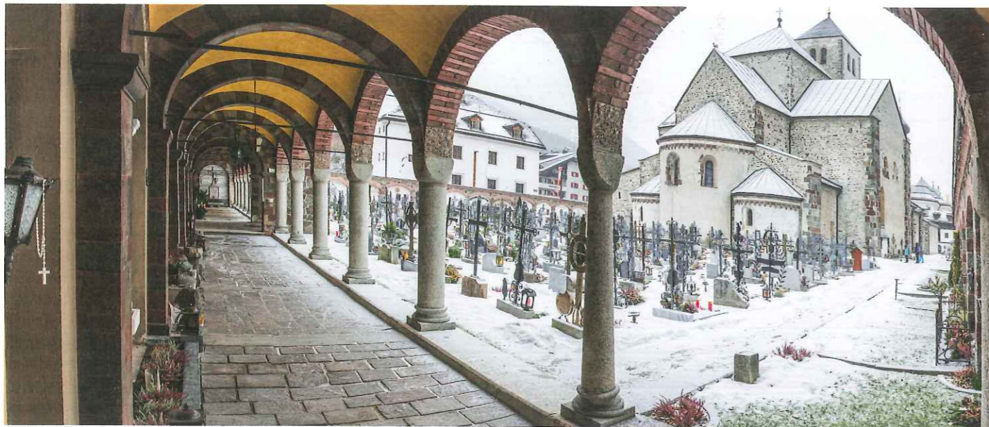
Das Benediktinerkloster zum heiligen Candidus wurde bereits 769 durch den bayerischen Herzog Tassilo III. gegründet. Bis 1803 zählte es zum Hochstift Freising.