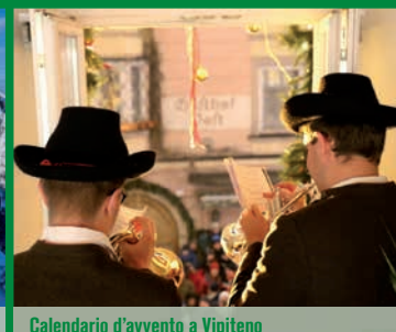
Calendario d'avvento a Vipiteno