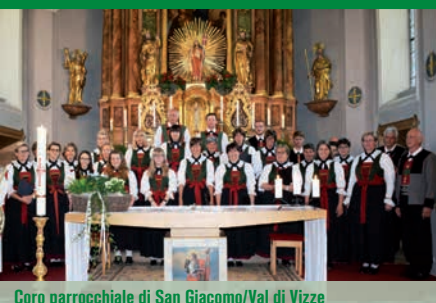
Coro parrocchiale di San Giacomo/Val di Vizze