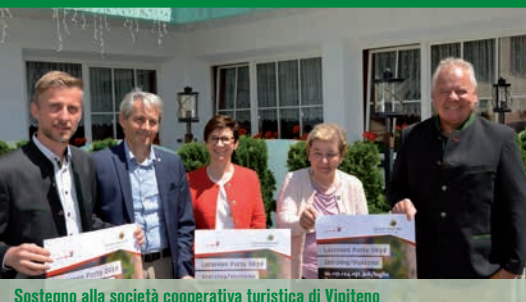
Sostegno alla società cooperativa turistica di Vipiteno

Facciamo affidamento sui nostri collaboratori.