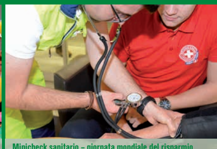
Minicheck sanitario – giornata mondiale del risparmio