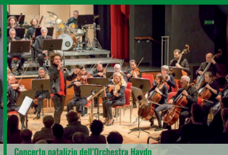
Concerto natalizio dell'Orchestra Haydn