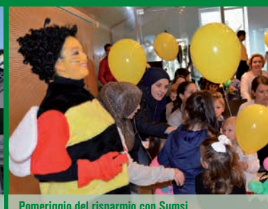
Pomeriggio del risparmio con Sumsi