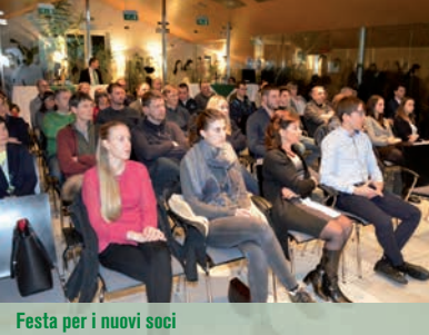
Festa per i nuovi soci