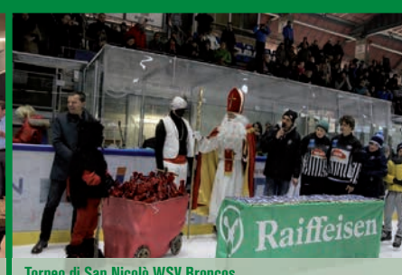
Torneo di San Nicolò WSV Broncos