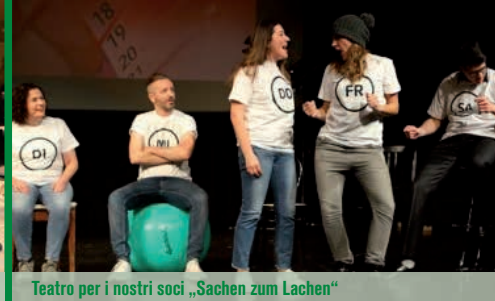
Teatro per i nostri soci „Sachen zum Lachen“