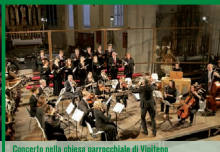
Concerto nella chiesa parrocchiale di Vipiteno