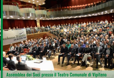
Assemblea dei Soci presso il Teatro Comunale di Vipiteno