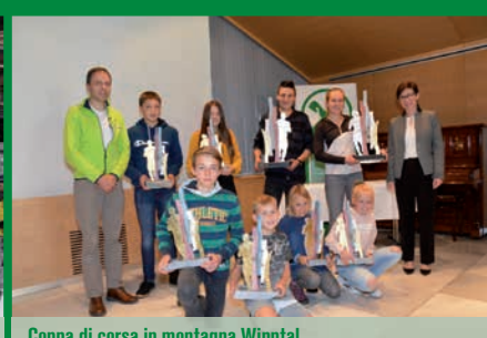
Coppa di corsa in montagna Wipptal

Crediamo nei giovani e sosteniamo le associazioni sportive.