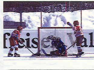
Le „Hockey Club Alta Badia“