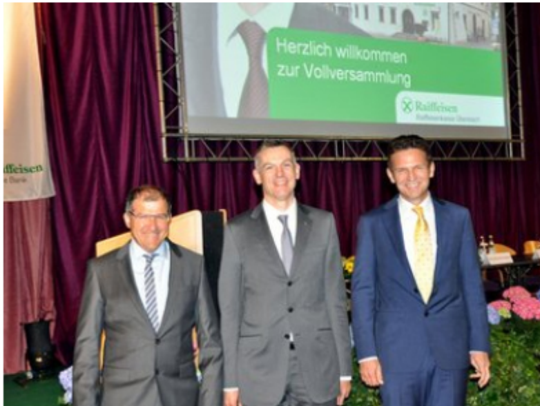
Genehmigung der Bilanz