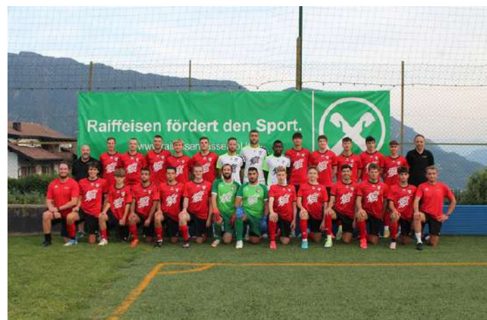
FC Tirol Fußball