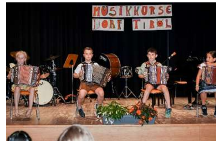
Musikkurse Dorf Tirol - Ziehharmonika