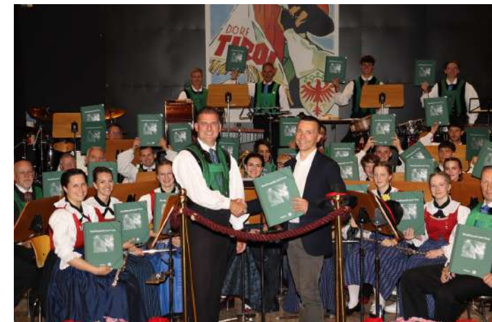
Musikkapelle Dorf Tirol