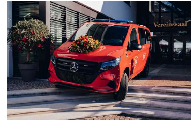
Freiwillige Feuerwehr Tirol - Ankauf Fahrzeug