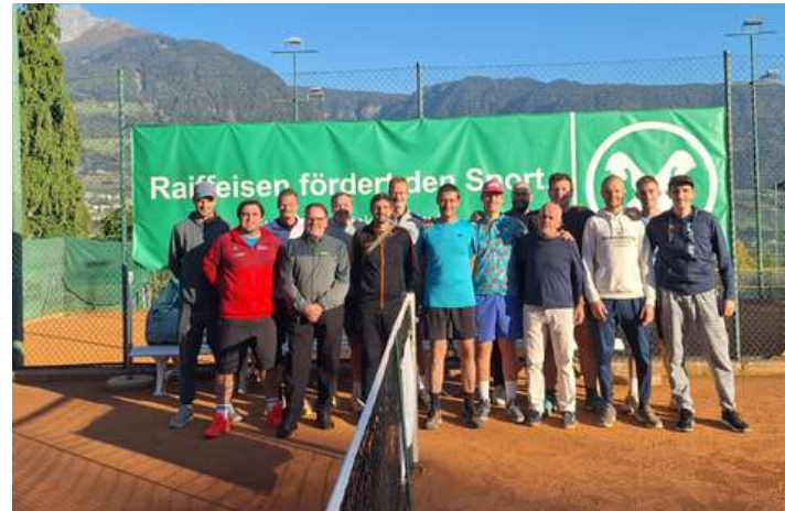
Amateursportverein Tirol Sektion Tennis

Alle Bereiche unserer Gesellschaft fanden bei den jeweiligen Anfragen ein offenes Ohr des Verwaltungsrates: der Tourismus, der Handel und die Gemeinde wurden ebenso unterstützt wie auch die Sportvereine; die Sponsoring- und Werbeaktivitäten wurden im Jahr 2025 wesentlich erhöht und haben 69 Tsd. Euro betragen, während es im Jahr 2024 noch 49 Tsd. Euro waren. Zudem wurden im Jubiläumsjahr vom Verwaltungsrat insgesamt 41 Tsd. Euro an Spenden aus dem Dispositionsfonds für die Förderung und Unterstützung von gemeinnützigen Einrichtungen und Initiativen im Tätigkeitsgebiet zur Verfügung gestellt.