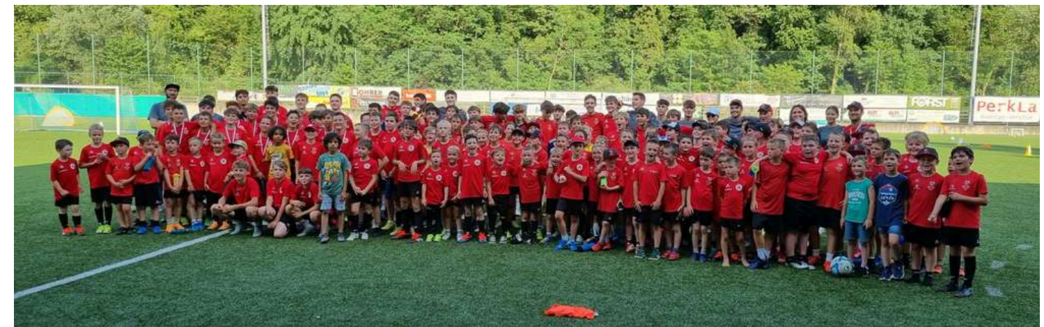
FC Tirol Fußball