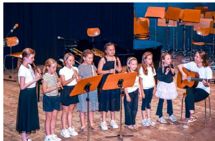
Musikkurse Dorf Tirol - Blockflöte