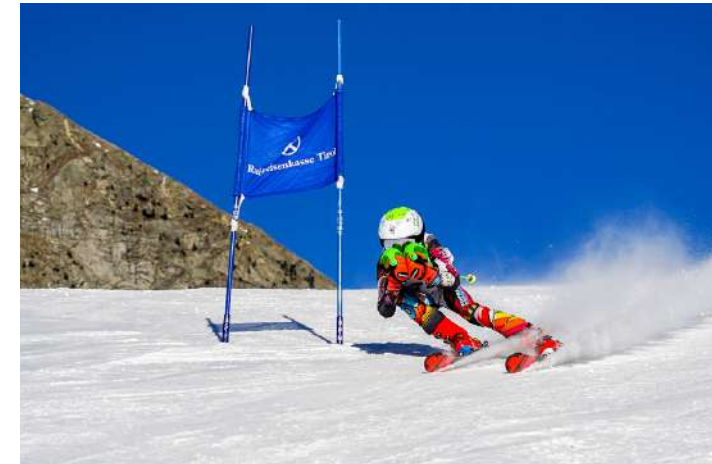
Amateursportverein Tirol Sektion Ski