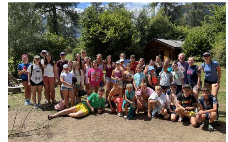
Jungschar Ortsgruppe Tirol - Zeltlager 2025