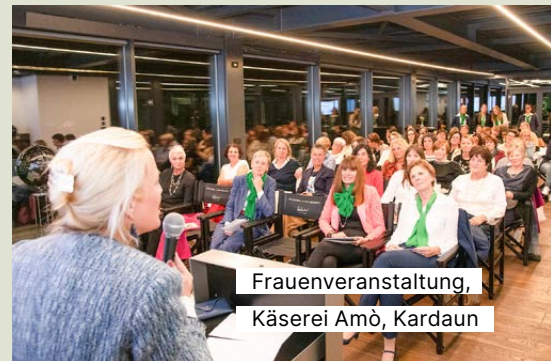
Frauenveranstaltung, Käserei Amò, Kardaun

Exklusive Veranstaltungen für Mitglieder und Kund*innen finden auch im Jahr 2026 statt!