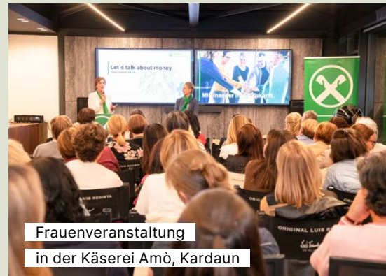
Frauenveranstaltung in der Käserei Amò, Kardaun