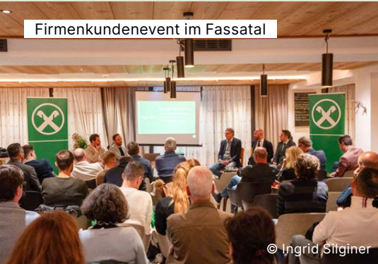
Firmenkundenevent im Fassatal