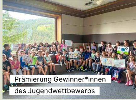
Prämierung Gewinner*innen des Jugendwettbewerbs