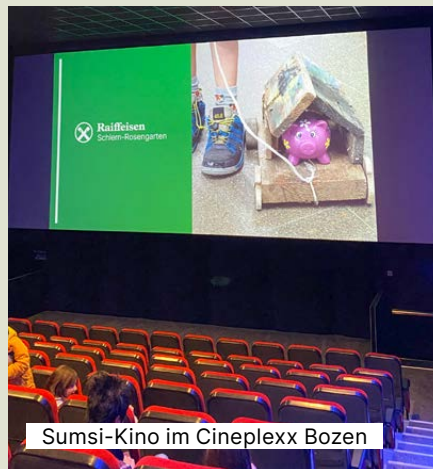
Sumsi-Kino im Cineplexx Bozen