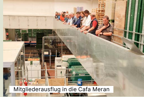
Mitglieder Ausflug in die Cafe Meran