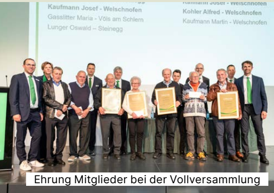
Ehrung Mitglieder bei der Vollversammlung