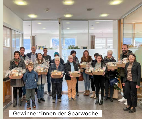
Gewinner*innen der Sparwoche