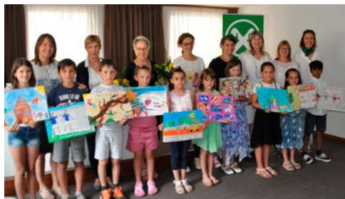
I vincitori della Bassa Atesina