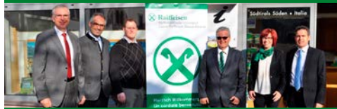
Associazione turistica Ora Montagna Egna Salorno