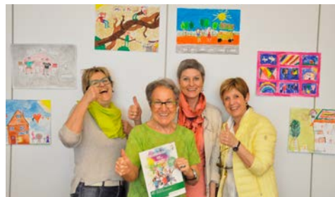
I disegni che hanno vinto