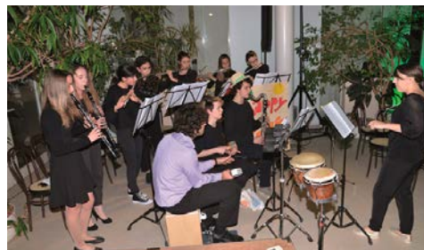
Intermezzo musicale della banda musicale giovani Laives-Bronzolo