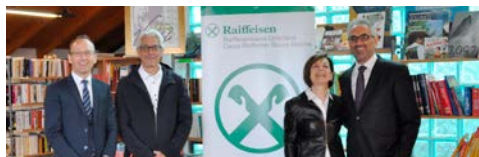
Circolo Culturale A. Vivaldi

Con il sostegno finanziario delle organizzazioni la Cassa Raiffeisen vuole dare un contributo allo sviluppo sociale della Bassa Atesina e ringraziare tutti i cittadini volontari per il loro grande impegno.