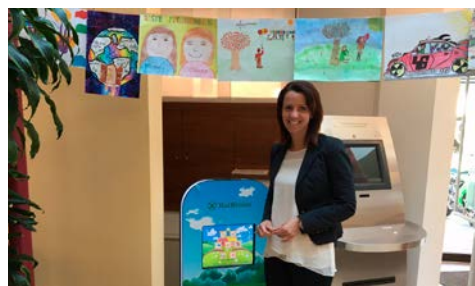
I disegni della filiale di Laives