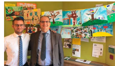
I disegni della filiale di Montagna