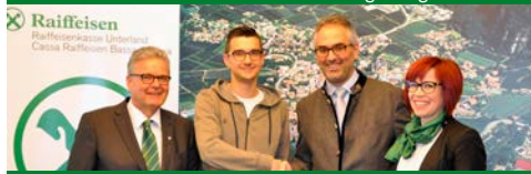
Verein der Vereine Auer-Ora