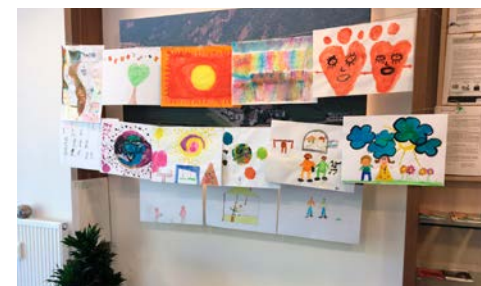
Disegni consegnati presso la filiale di Vadena