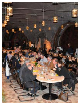
Degustazione vini nella "Cantina nella roccia"

Questa serata si è rivelata un riuscito evento in una suggestiva cornice.