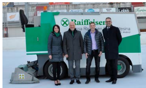
SSV Leifers ASD