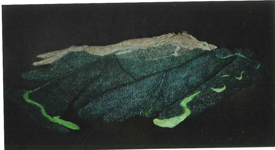
Der Kronplatz im Sommer