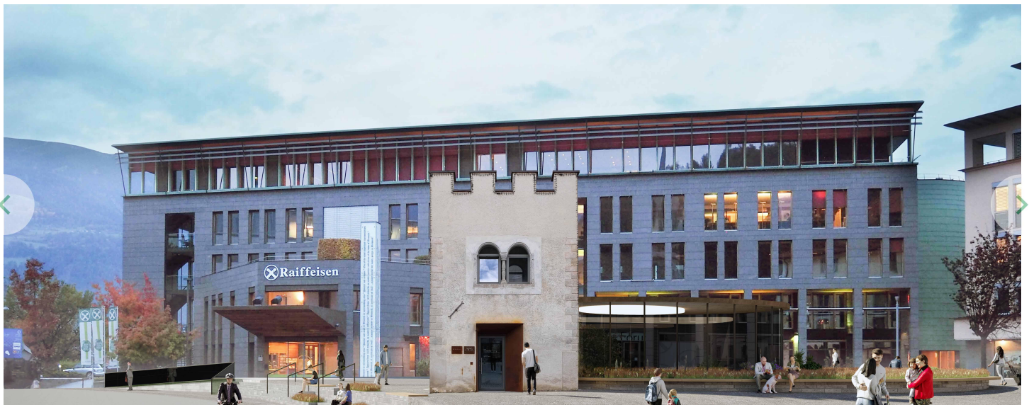
Ansicht Raiffeisenplatz Bruneck (Renderings: raymotion)

Die Raiffeisenkasse Bruneck präsentiert nach einem erfolgreichen Ideenwettbewerb und mehrjähriger Planung die konkreten Pläne zur Umgestaltung des Raiffeisenplatzes. Das Projekt ist ein weiterer Schritt, den die Genossenschaftsbank unternimmt, um einen zukunftstauglichen Mehrwert für die örtliche Gemeinschaft zu schaffen. Dabei verfolgt sie eine ganzheitliche Lösung und realisiert das Bauvorhaben im Stadtzentrum nicht nur ober- sondern auch unterirdisch.