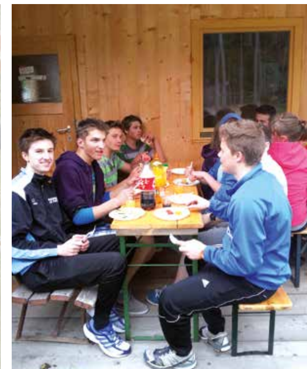
Die Klasse der WFO im Hochseilgarten von Toblach