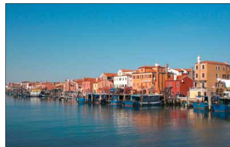
▲ Der Mitgliederausflug nach Chioggia