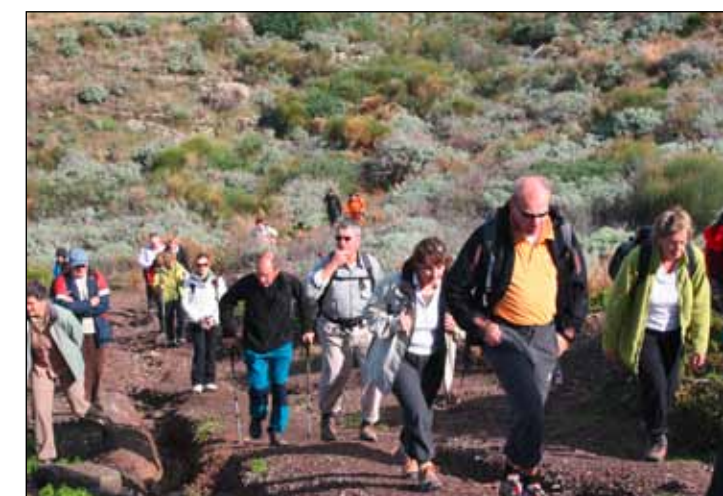
▲ Die Wanderwoche „Sizilien und die Eolischen Inseln“