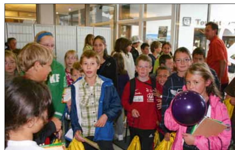
▲ 215 Schüler holten sich am 1. Schultag das traditionelle SCHUALSACKL ab

► 90 Ringmappen, 480 Schnellhefter, 255 Schreibblöcke, 880 Einlegehüllen, 125 Notizblöcke, 140 Kugelschreiber und 8 Bücher überreichten wir zu Beginn des Schuljahres an Schule und Kindergarten