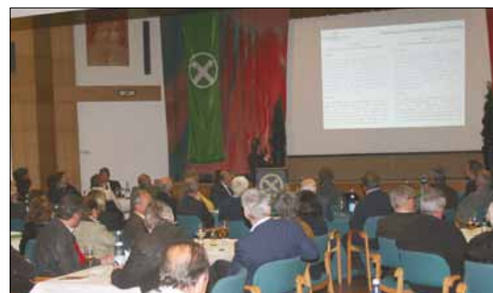
▲ Die Vollversammlung der Raiffeisenkasse Tirol fand am 24. April statt.